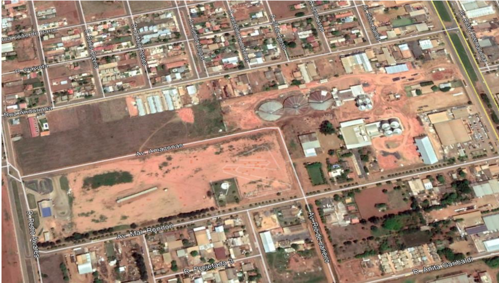
Vista parcial da área em regularização Reurb –E