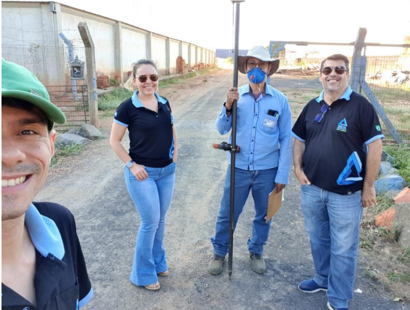
Equipe da Delta Engenharia e Meio Ambiente de Campo Novo do Parecis