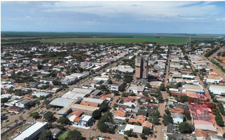
Imagem do centro de Campo Novo do Parecis